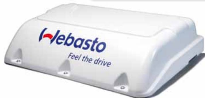
Compact Cooler 5 Lite