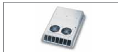
Compact Cooler 4 E