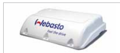
Compact Cooler 5 Lite