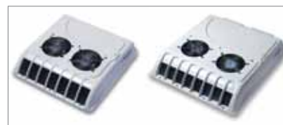
Compact Cooler 5 Compact Cooler 8